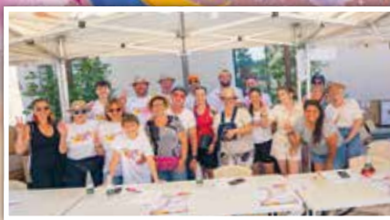
Distribution des kits