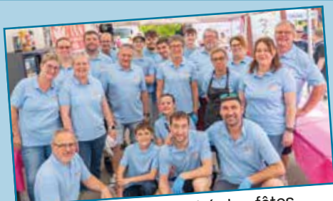
L'équipe du Comité des fêtes