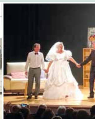
Patincofin - Théâtre