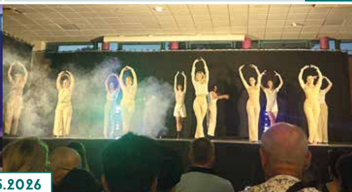
FJEP - Gala de danse