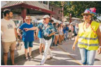
Certifié par huissier