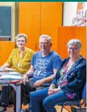
Nouveau bureau d'ACL