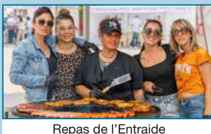
Repas de l'Entraide