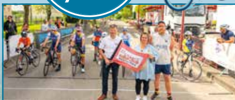
Départs des courses