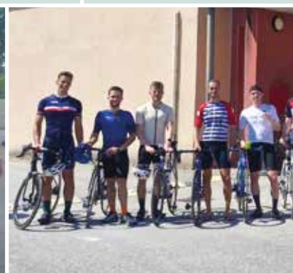
Accueil des marins au CFIS pour le