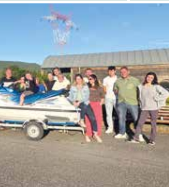
Jet Ski & sponsors