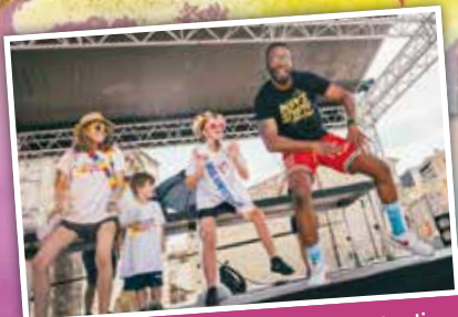
Échauffement avec Body studio