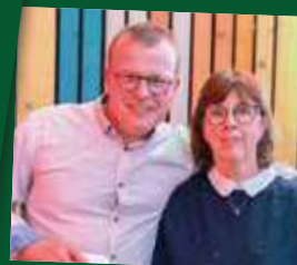
Boucherie Chez Tom's