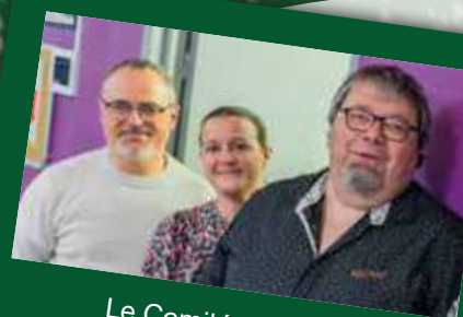
Le Comité des fêtes