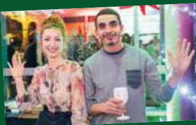
La brasserie de Cruas