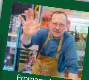
Fromagerie de l'Ardéchois